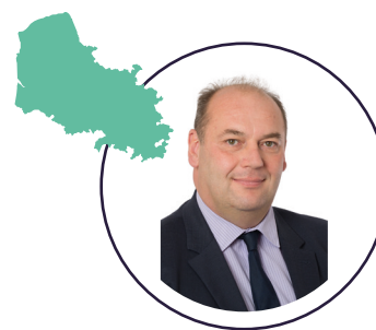
JEAN-FRANÇOIS RAPIN sénateur du Pas-de-Calais