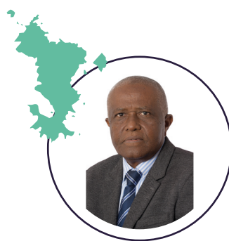
ABDALLAH HASSANI sénateur de Mayotte